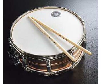
La caisse claire