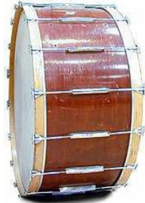
La grosse caisse